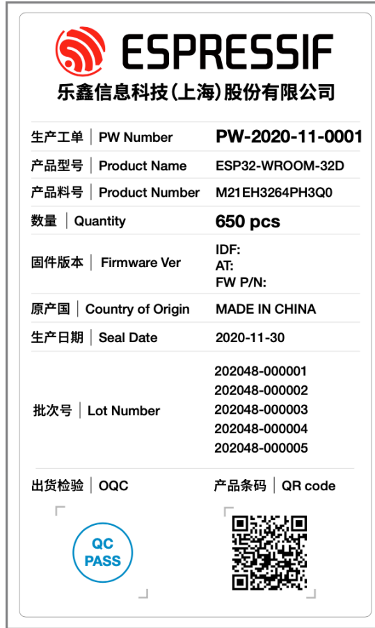
图 3: 模组物料标签