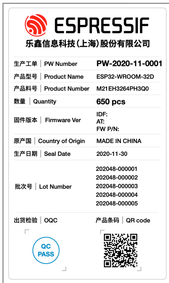
图 2: 模组物料标签